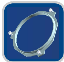
FAN anillo de protección