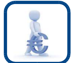
FAN original; la decisión correcta