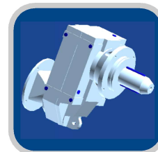
FAN kit de reparación sello de casete