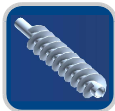
FAN tornillo sinfín & restauración